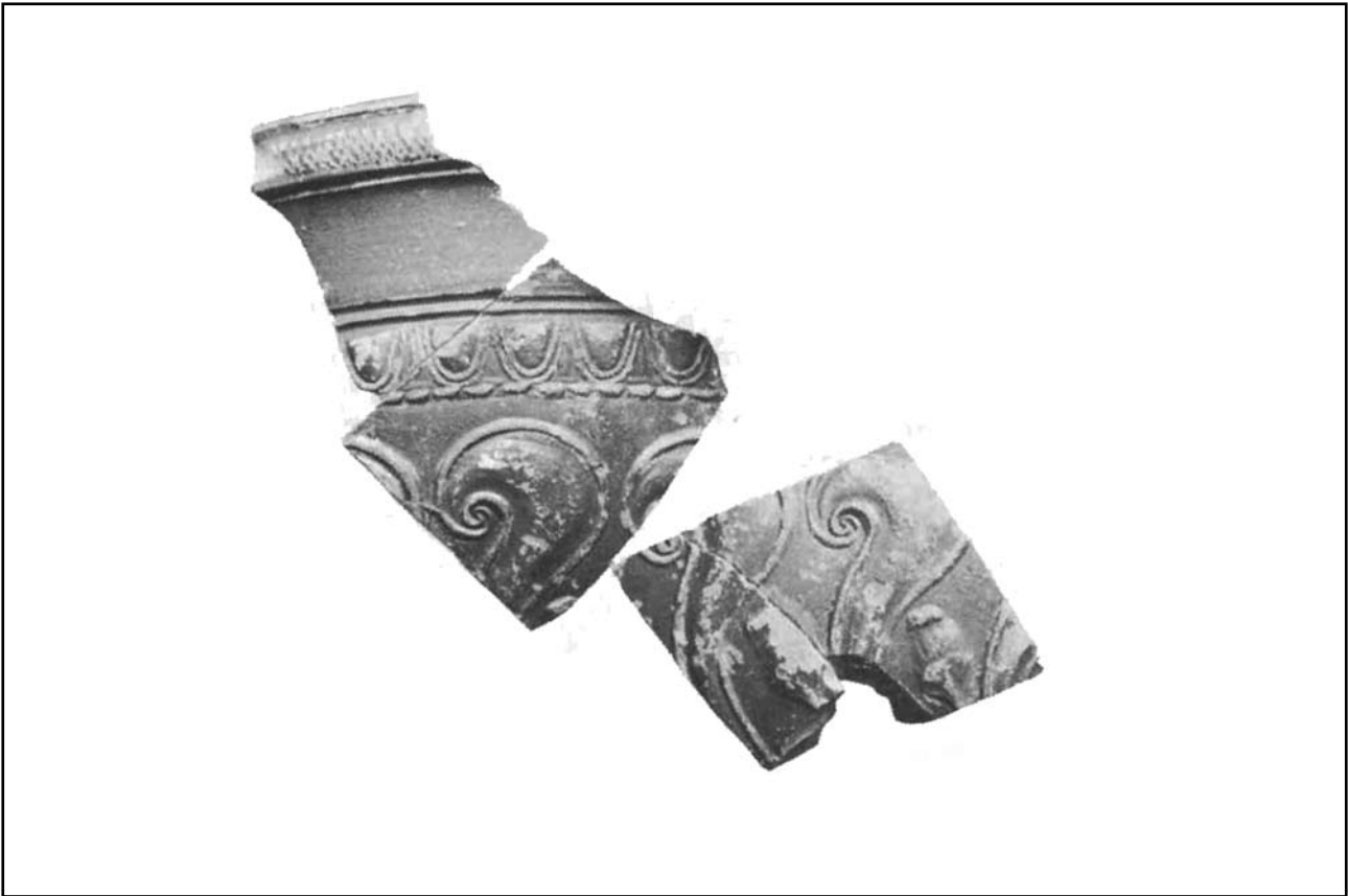
Vas atribuïble a Ateius trobat a Pollentia (Ettlinger, 1983)