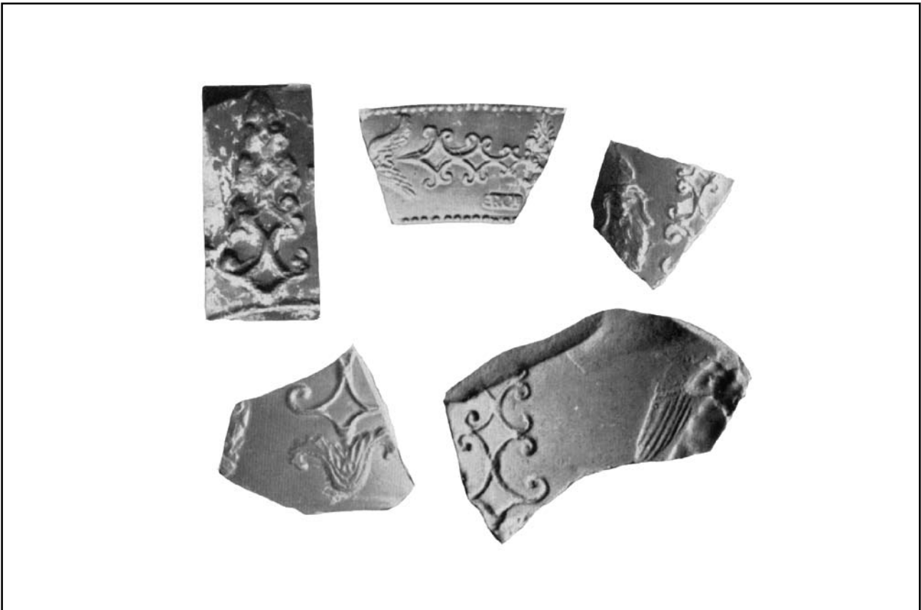
Fragments, amb el punxó de la peça núm. 7, de la terrisseria d'Annius (Stenico, 1959)